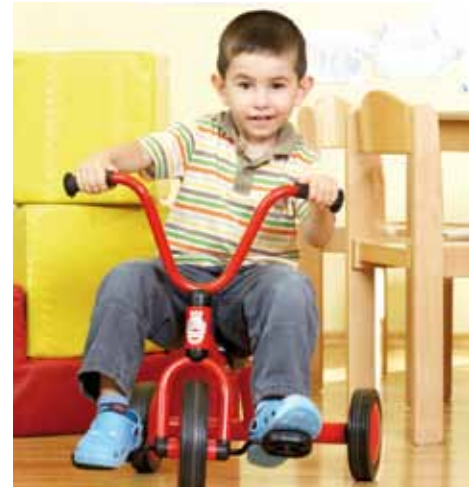
Durch Bewegung erforschen Kinder ihre Umwelt.

Bewegung ist eine fundamentale Handlungs- und Ausdrucksform von Kindern. Ihr kommt eine Schlüsselfunktion im Rahmen der Entwicklung kognitiver, emotionaler, sozialer und kommunikativer Fähigkeiten zu. Dem natürlichen Bewegungsdrang der